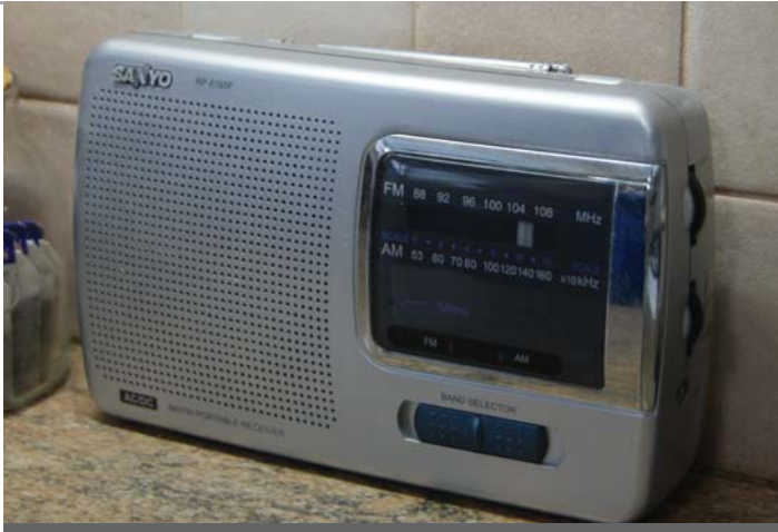
ပုံရိပ်။ ဓာတ်ခဲအားသုံး ရေဒီယို