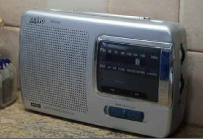
صورة: راديو يشتغل بالبطارية