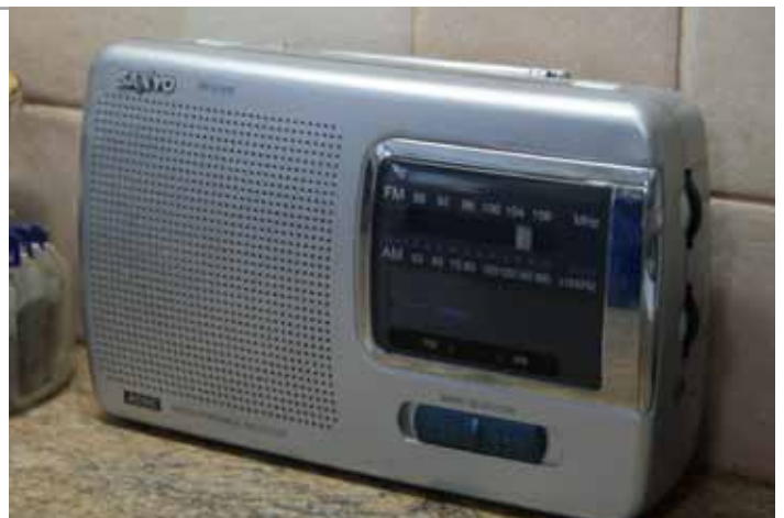
රූප (Image): බැටරි මගින් ක්‍රියා කරන ගුවන් විදුලියක්