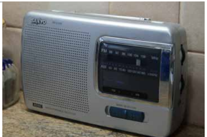
Слика: Радио апарат на батерије