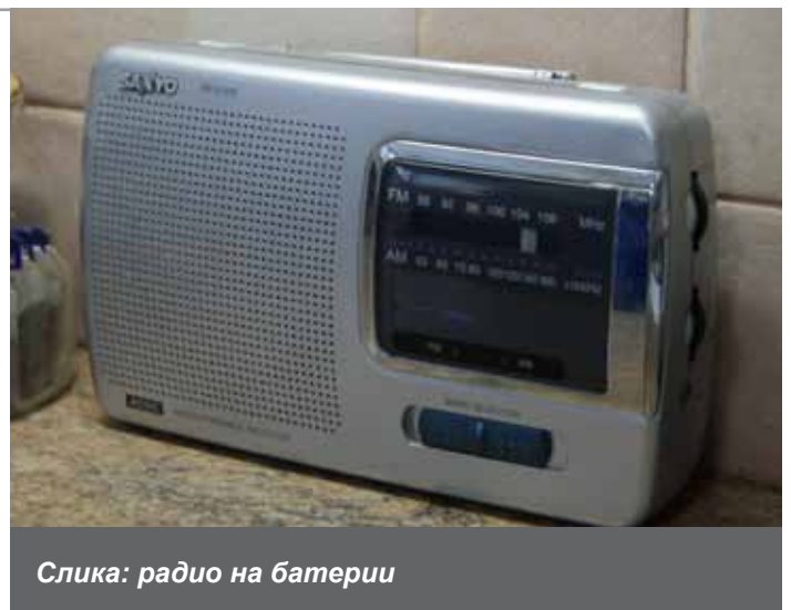
Слика: радио на батерии