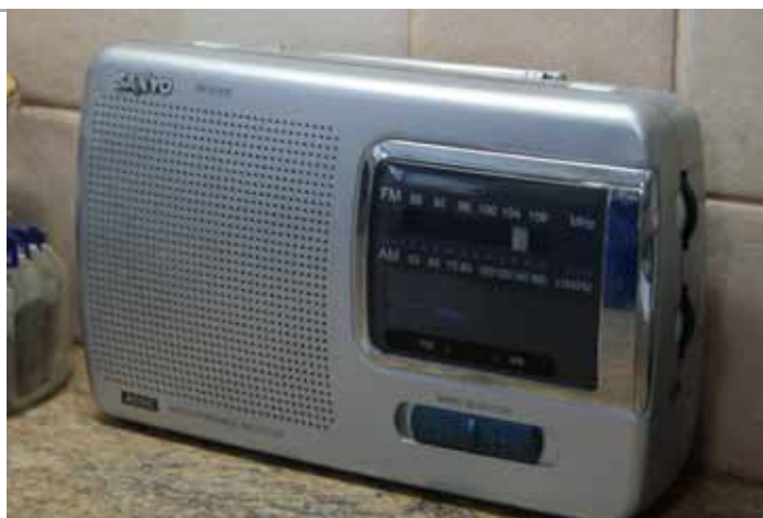
Slika: Radio na baterije (tranzistor)